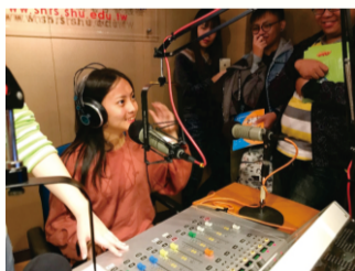
107年11月1日(四)中五參訪：世新大學廣播電視電影教學中心