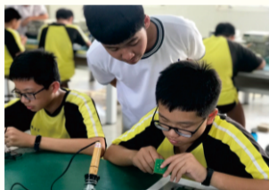
107年11月14日(三)中二技職參訪：屏東高工電子科