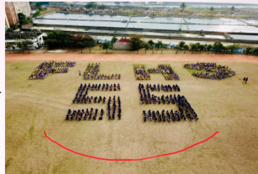
55校慶人形排字團練

期待我們枋中學子在師長的教育下，個個都能成為具備未來公民關鍵能力的卓越人才，讓枋中的教育價值與精神延續與傳遞下去。