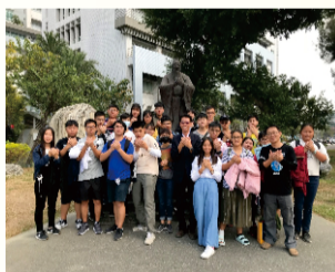
107年10月31日(三)中五參訪：嘉南藥理大學