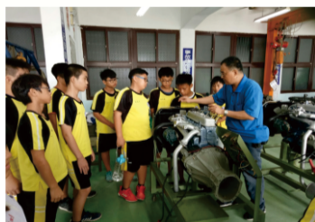
107年11月14日(三)中二技職參訪：東港海事輪機科