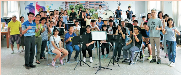
▲成果發表會圓滿大合照