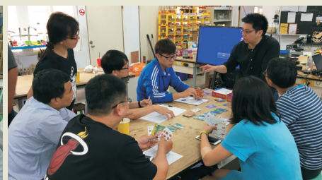
▲本校國高中數學科教師運用共同時間參加桌遊數學研習。