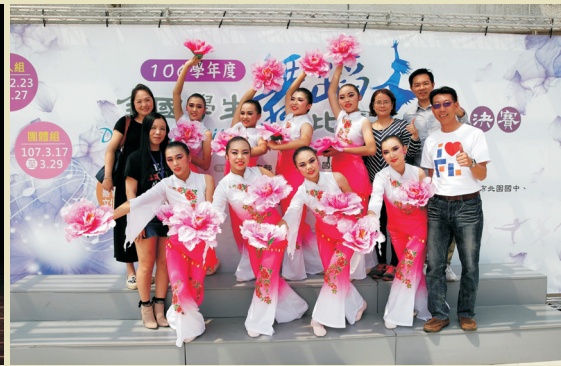
▲比賽選手與校長和主任合影