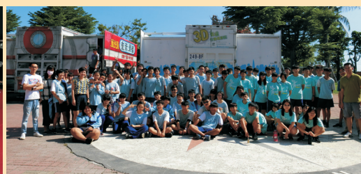
▲學生及教師在科教車完成科學體驗後，於科教車前合影留念。