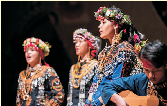
▲本校奪冠學生於6/14晚間於國父紀念堂進行成果公演

【感謝 兩岸好報-記者吳富正 報導】2018「活力·E起舞動」第十六屆全國原住民族青少年及兒童母語歌謠暨歌舞劇競賽，經過激烈評選過程，歌謠競賽國中暨國小組由本校國中部獲得冠軍，並於6/14晚間在國父紀念館大會堂盛大舉行成果公演，觀眾對於枋中學生平實卻能觸動人心的悠揚歌聲，大表讚賞。