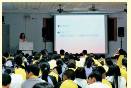
▲107年06月01日(五) 職涯講座: 大眾傳播業介紹-中天主播高孟柔 校友