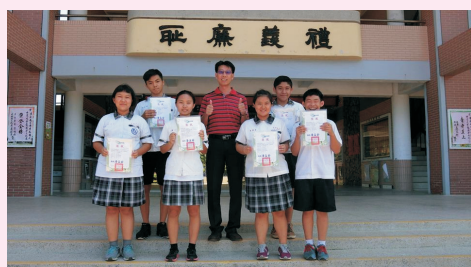
▲得獎同學與校長合影並頒發獎狀，獎勵嘉勉。

枋寮高中參加107年度屏東縣潮州區語文競賽，在各組選手全力以赴參賽之下，於「閩南語演說」「國語朗讀」「作文比賽」三項奪冠，成績優異，恭喜獲獎同學，感謝辛勤的指導老師及全力支持各位校長、老師及同學，並頒發獎狀，獎勵嘉勉。