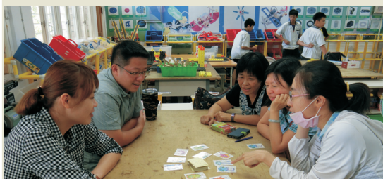
▲本校國高中國文科及英文科教師運用共同時間參加桌遊語文研習。

本校推展新課綱，透過高中優質化輔助方案的協助，讓教師藉由桌遊的認識、運用，使其轉換並融入課程教學，提升教師教學效能。將桌遊融入教學活動，提升學生之學習意願及成效。教師間藉由增能研習來加深、加廣教師教學內容，拓展教學視野，也有助教師社群的發展與精進。