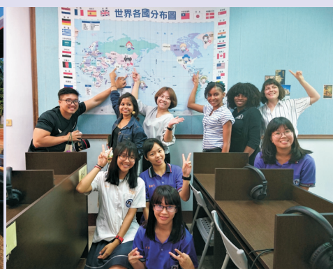
▲大家指著地圖上自己的國家，齊聚在枋中的感覺，真是既興奮又美妙