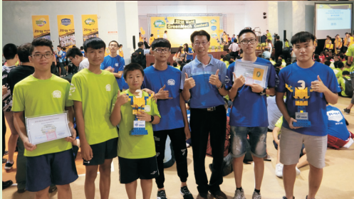
▲透過自造者理念學校的課程發展與推動，枋寮高中的學生從課程學習參與，落實「做中學，學中做」。有用的學習，越來越多的學子自主學習，由機構組裝、程式設計、團隊合作、解決問題的過程中，獲得最佳的學習！