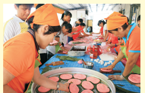
▲107年04月19日(四) 志工活動: 天時村愛鄉協進會