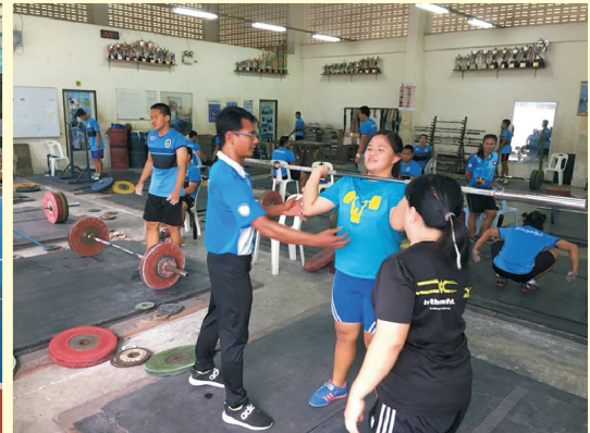
▲本校舉重隊學生接受泰國教練國際交流指導