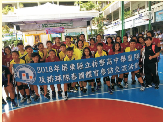
▲本校排球隊至泰國進行國際體育交流活動

枋寮高中南向體育交流，泰國中學特別高掛兩國國旗與枋寮高中英文校名之布條，以示歡迎與尊重，並以學校特色迎賓舞曲歡迎枋寮高中蒞臨，校長及師生與本校團隊友善互動，親切交流，並交換紀念旗與紀念品！枋寮高中不僅發揮體育專業交流與推動國際教育，同時也做了非常棒的國民外交！