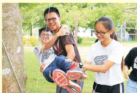
▲107年07月11日(三) 職涯團體: 愛克曼協會