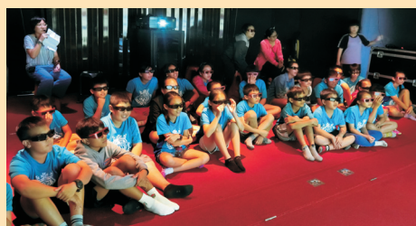
▲學生帶上3D眼鏡觀看3D電影，將環境保護議題與學生生活相連結。

本校辦理行動科學教育館縣市科學巡迴教育活動，讓枋寮地區高、國中小師生體驗不同課程，枋中團隊除了本身教學與行政工作之外，額外付出心血帶領枋中教師與學生服務社區國小，讓小學生自然開心的學習科普知識，看見這些孩子們天真的笑容，對科學的好奇與渴望，欣賞影片時感動自然流露的眼淚，就會讓我們覺得值得了。參加學校人次：春日國小60人、古華國小31人、建興國小81人、玉光國小27人、力里國小32人、加祿國小32人、楓港國小12人、佳冬國中80人、僑德國小78人、枋寮國小108人、東海國小79人、枋寮高中408人，合計1017人次。