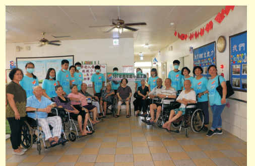
▲107年07月04日(三) 志工活動: 枋寮鄉老人養護中心