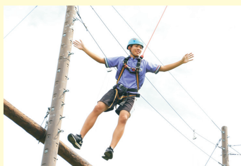
▲107年07月12日(四) 職涯團體: 愛克曼協會