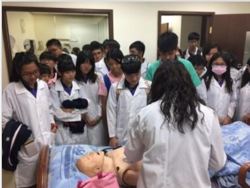
穿著醫師袍進入手術室，學生說對生命有了新體驗。