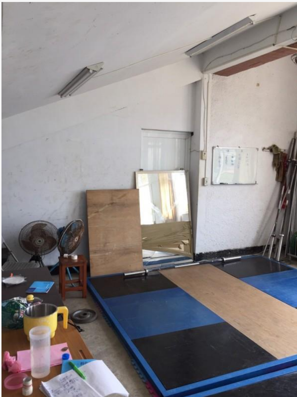
枋寮高中的舉重訓練室。