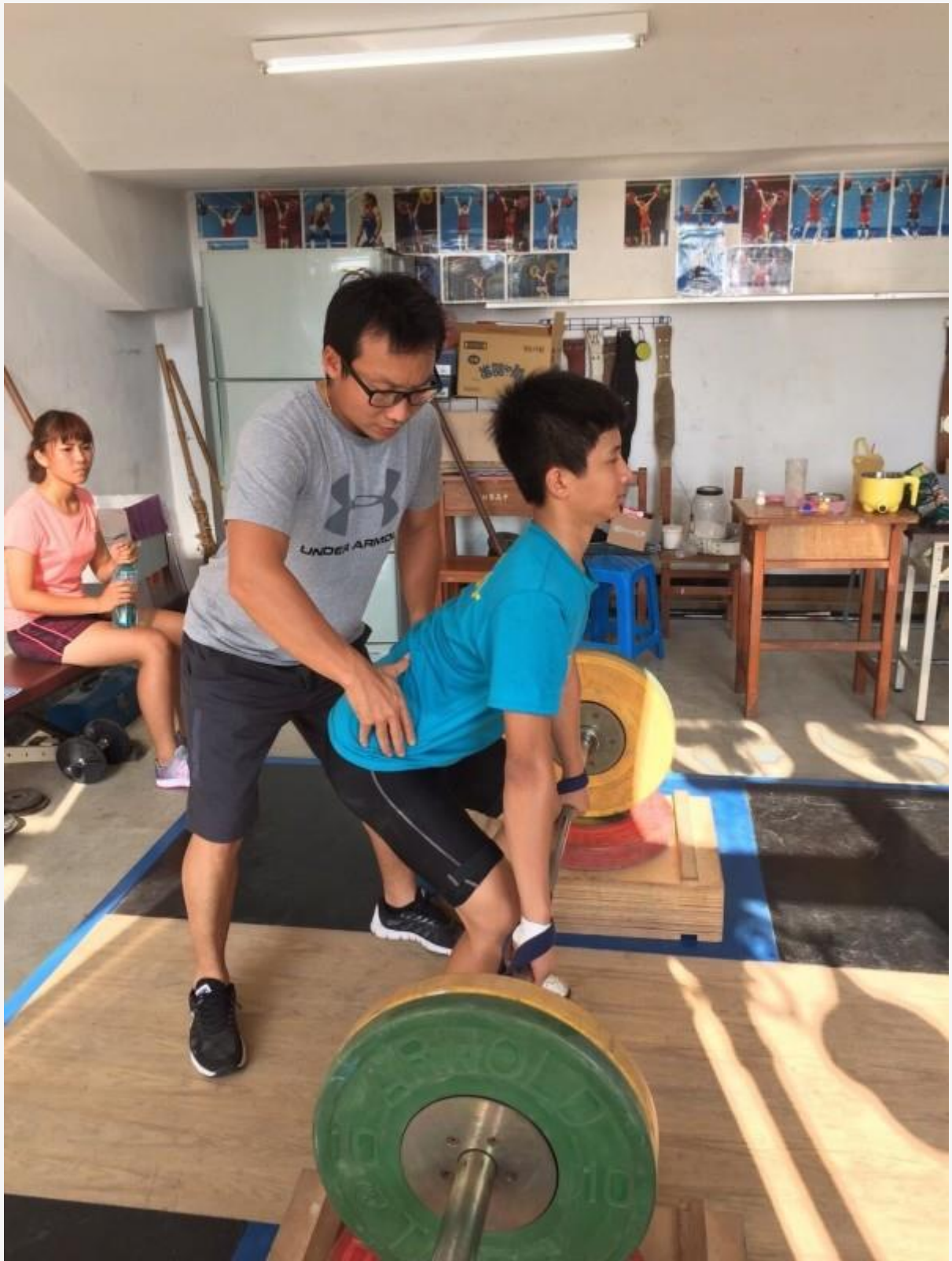
枋寮高中的舉重訓練室。