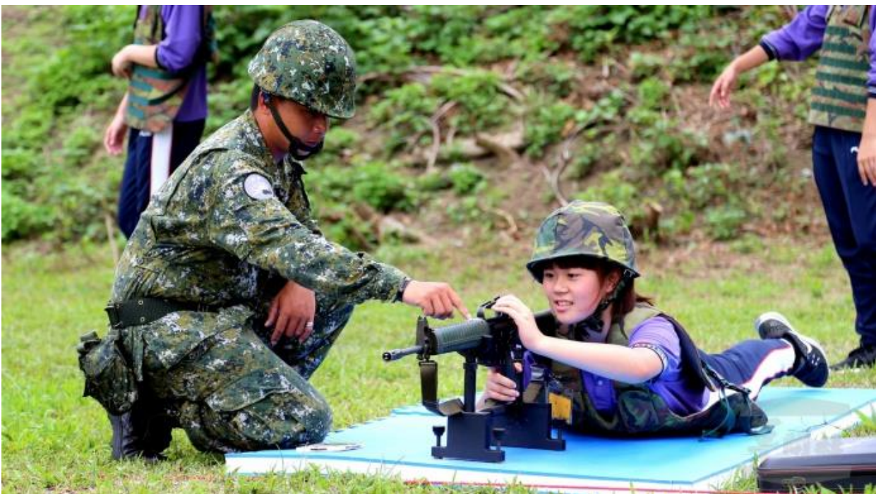
空軍舉辦「與高中生有約射擊體驗活動」，學子仔細聆聽助教說明槍枝操作要領。