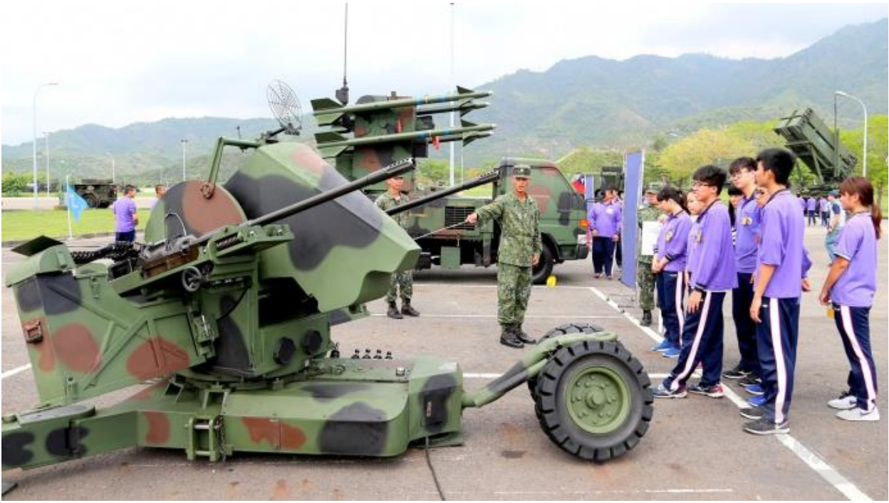
空軍「與高中生有約射擊體驗活動」，現場安排武器裝備陳展。