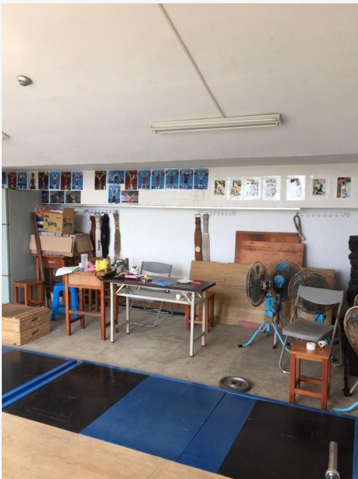
枋寮高中的舉重訓練室。