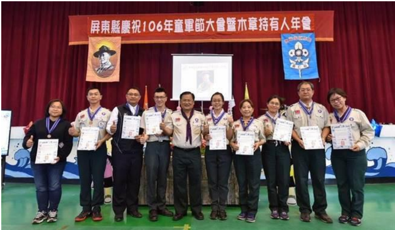
童軍節大狂歡，千名童軍齊聚枋寮高中。

屏東縣今年擴大慶祝 3 月 5 日童軍節，14 所國中、8 所國小、7 個社區童軍團等千名童軍齊聚枋寮高中一同歡慶，盛況空前的場面宛如 1 場嘉年華大會，活動中還配合 12 年國教多元課程社團教學，設計出銜接高級中等學校及國民中學的童軍教育，可謂是童軍新紀元。