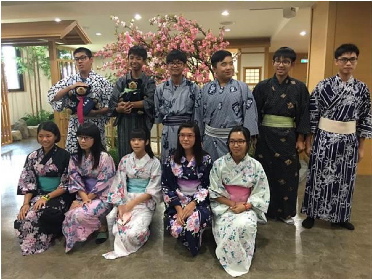
枋寮高中學生到義守大學體驗日本文化

義守大學近日邀請近百位屏東枋寮高中學生到義大體驗臨床醫療與日本文化；義大醫學院副院長楊智惠表示，義大重視學用合一，辦體驗活動讓學生發掘自己性向興趣，及早規畫職場生涯。