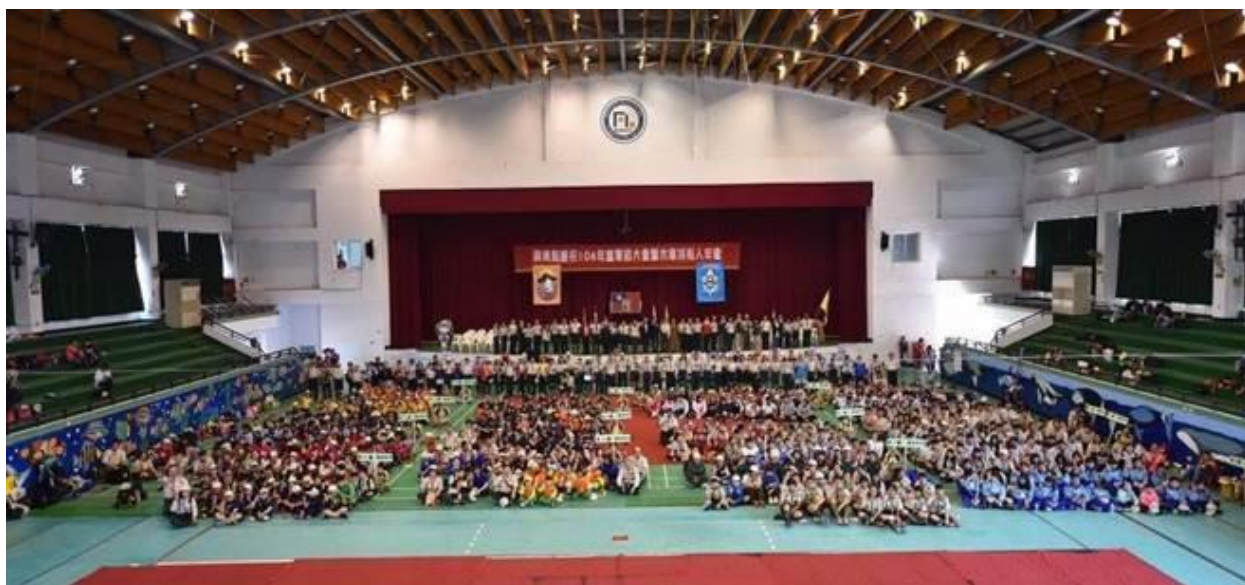
童軍節大狂歡，千名童軍齊聚枋寮高中。