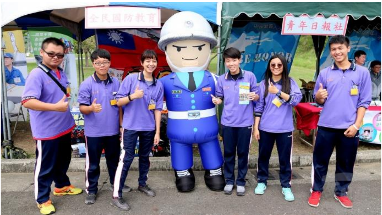
屏東枋寮高中近百名學生，26日參與空軍106年「與高中生有約射擊體驗活動」，認識國防、體驗國防。

（軍聞社記者吳柏毅屏東26日電）空軍司令部今日舉辦106年「與高中生有約射擊體驗活動」，參與學子們透過步槍實彈射擊與全民國防參訪的多元活動，從中體會軍人保家衛國的職責，進而有助深耕理念，認識國軍。