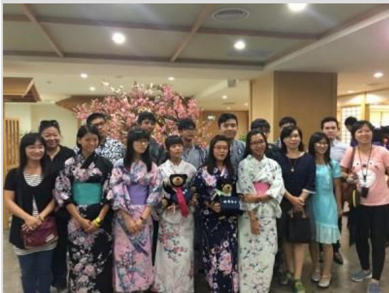
學生穿上和服覺得新奇。

義守大學推動學用合一，邀請 120 名枋中學生參與臨床醫療與日本文化體驗活動，期能幫助學生及早做職場生涯規畫。