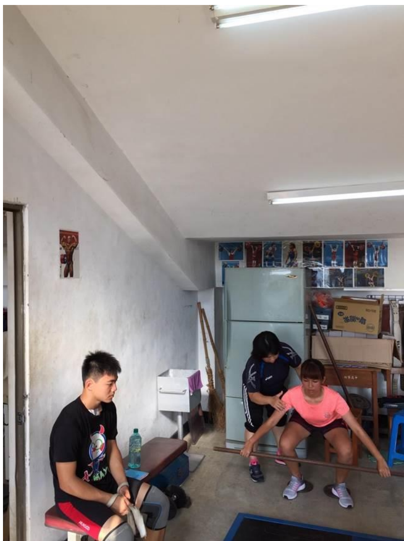
枋寮國中 10 名舉重隊隊員，就是在狹窄的體育館樓梯看台底下練習。