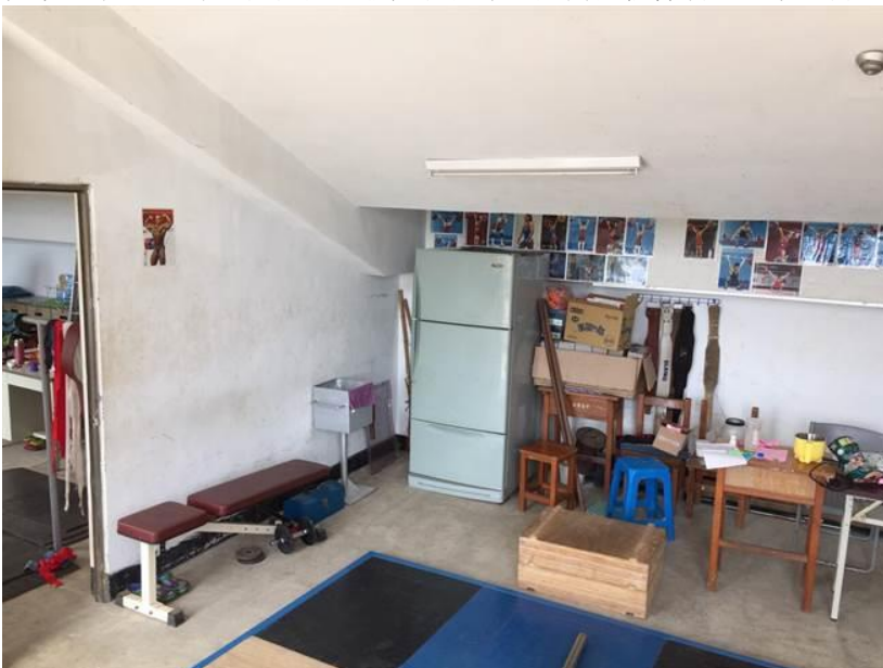
枋寮國中 10 名舉重隊隊員，就是在狹窄的體育館樓梯看台底下練習。（枋寮高中提供）