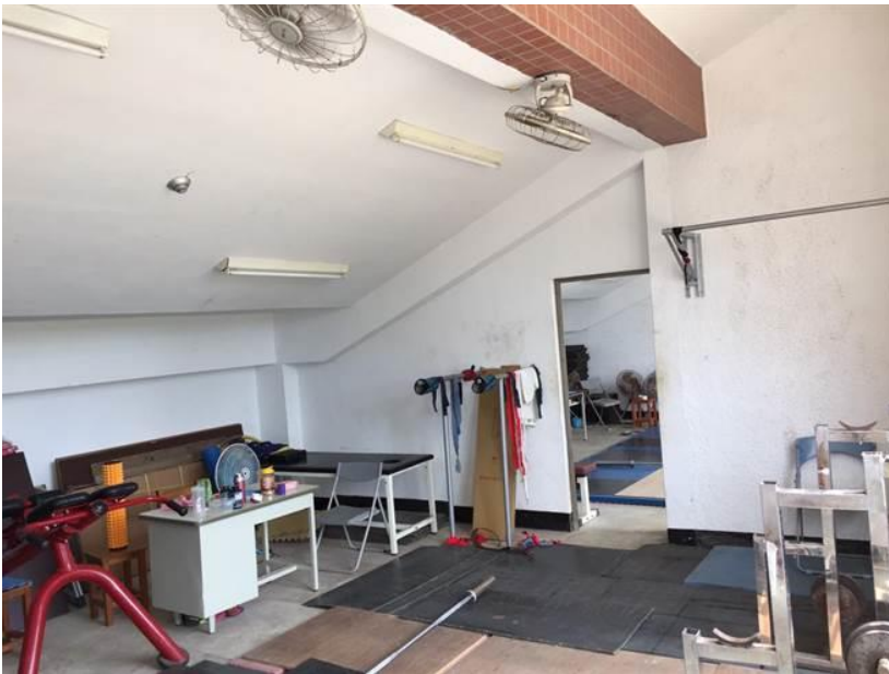
枋寮國中 10 名舉重隊隊員，就是在狹窄的體育館樓梯看台底下練習。