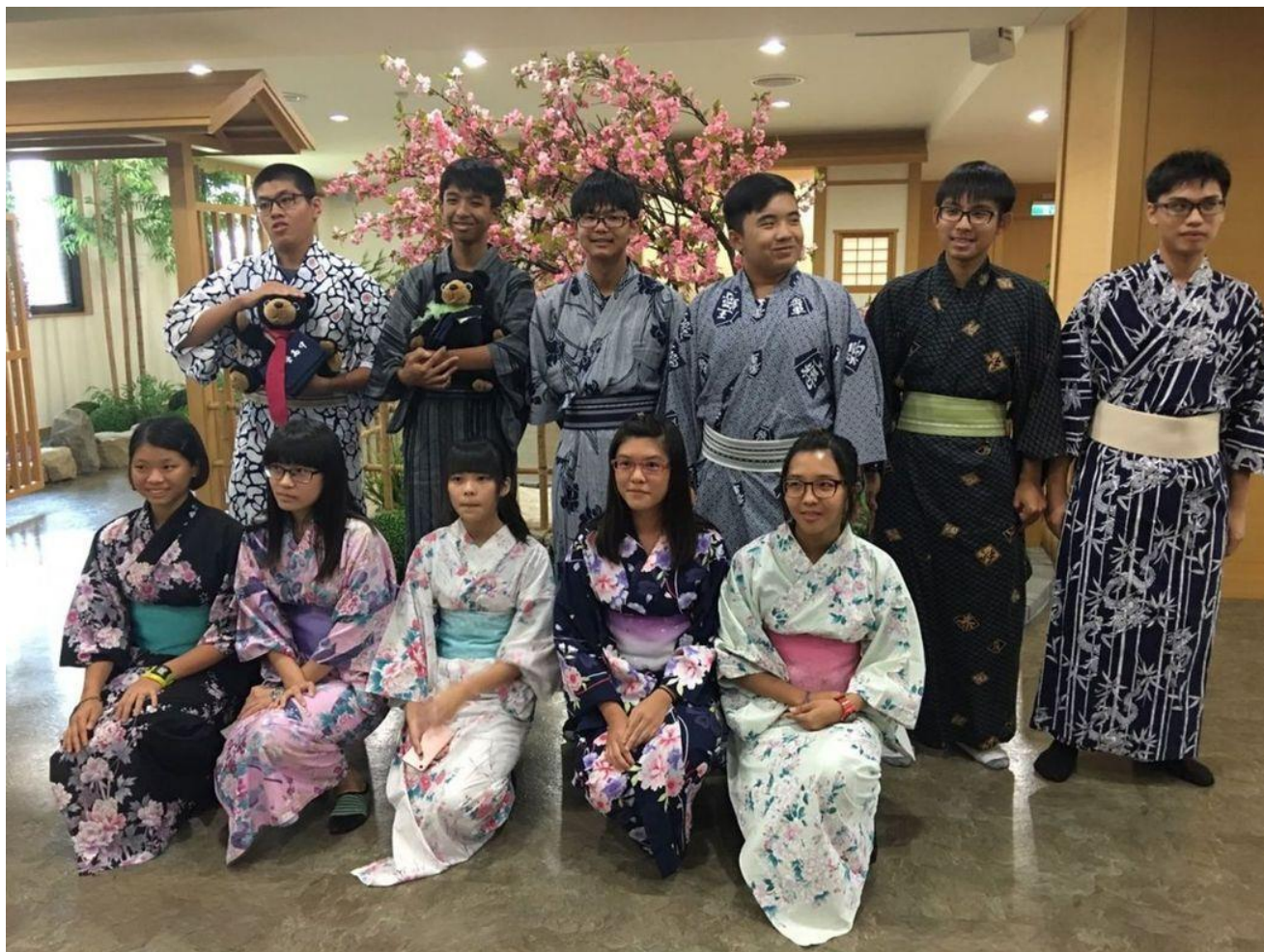
枋寮中學學生到義守大學進行日本文化一日體驗。記者王昭月／攝影

120名屏東枋寮高中學生今天到義守大學進行臨床醫療與日本文化「一日體驗」，學生穿上手術袍進入開刀房、中醫室，實際體驗醫療角色，感到很新鮮。