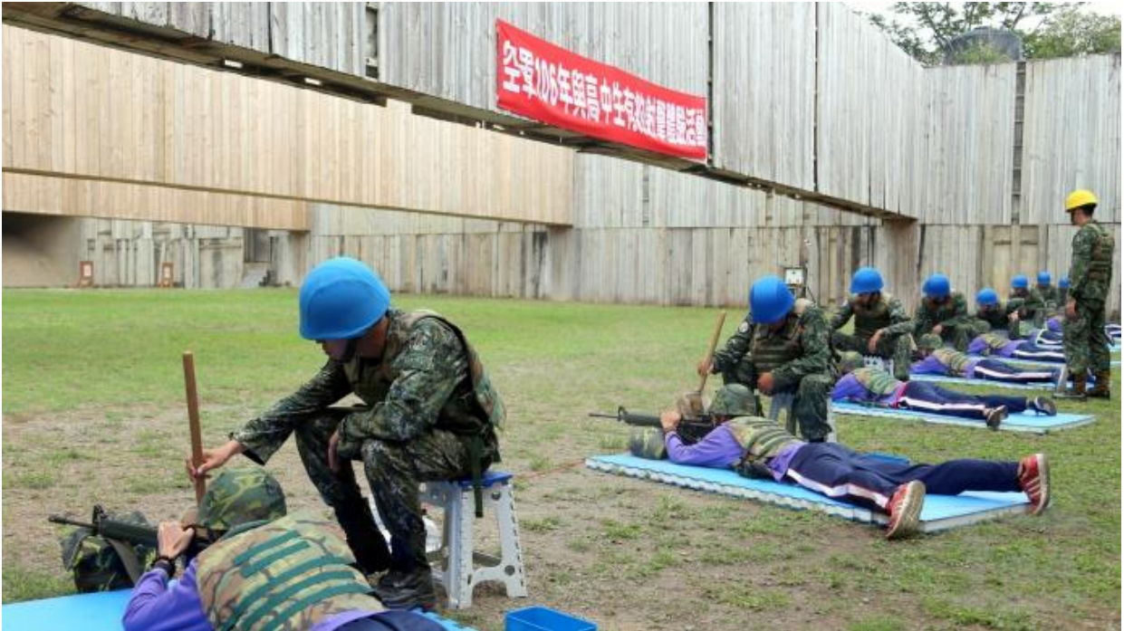
空軍司令部 26 日舉辦 106 年「與高中生有約射擊體驗活動」，學子們認真投入，近距離感受實彈射擊的震撼。