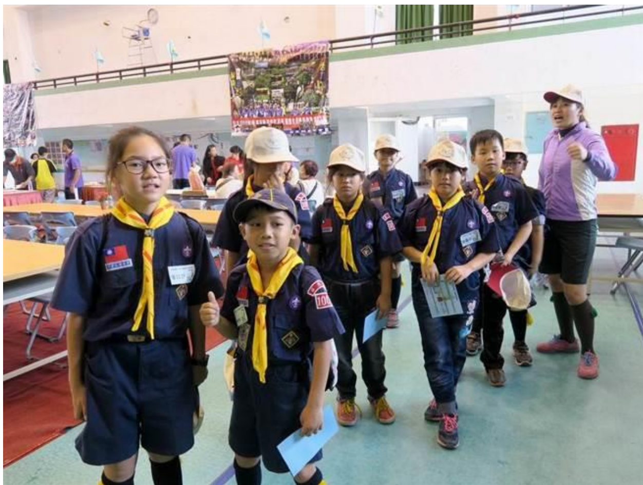
童軍節大狂歡，千名童軍齊聚枋寮高中。